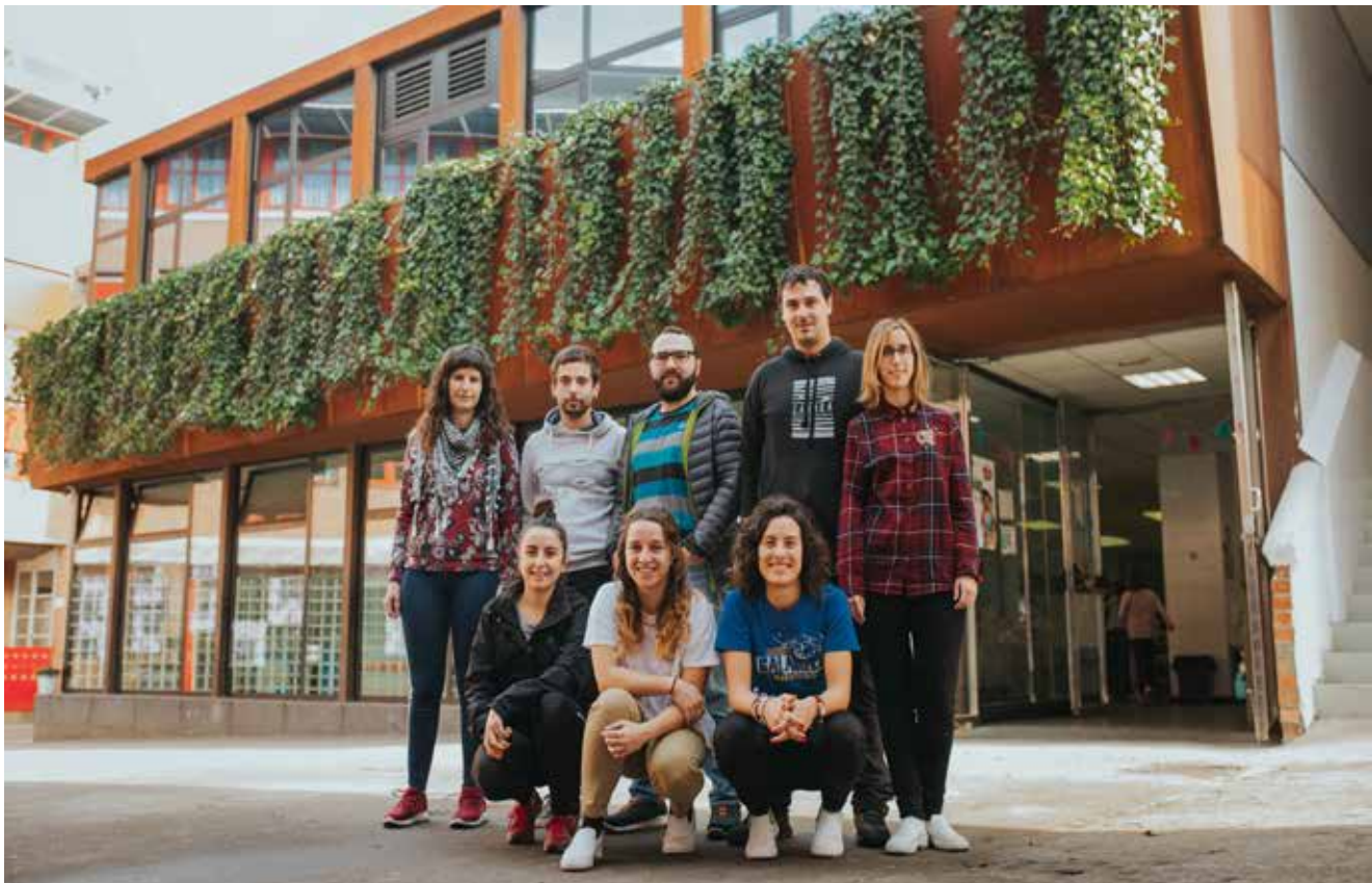
Equipo educativo del proyecto

Sabemos que no es un proyecto definitivo. Que necesitará aún ajustes y que las propias preferencias del alumnado nos indicarán, seguramente, cuál es el camino a seguir. En ello estamos.